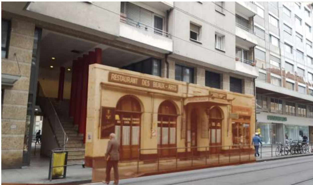
La rue de Carouge à la hauteur de « Harry-Marc » entre mai 1981 et 2018...