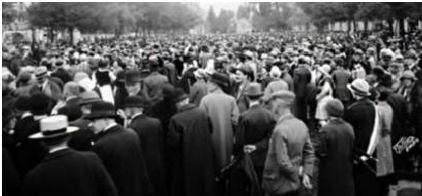
Jubilé de la Croix-bleue sur la Plaine de Plainpalais (9.1927)

Selon l' Echo de Plainpalais , en 1896, les hommes sont plutôt adeptes de feutres et casquettes à l'américaine.