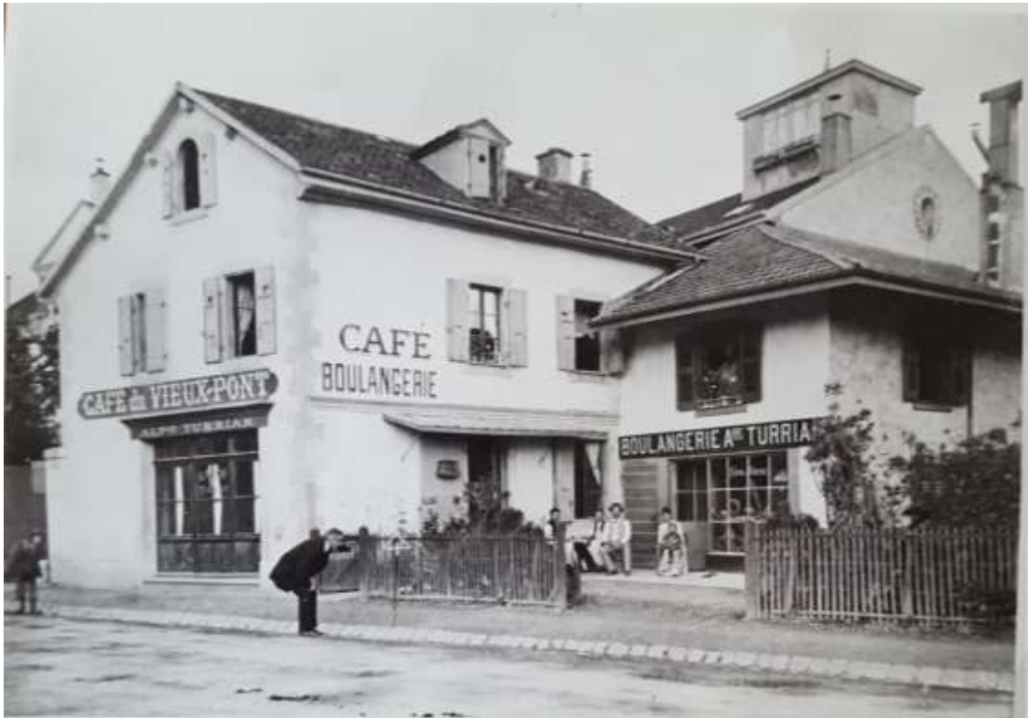
Café du Vieux-Pont, bd du Pont-d'Arve 51 (autrefois emplacement du cinéma Elysée, en face d'Uni-Mail !)