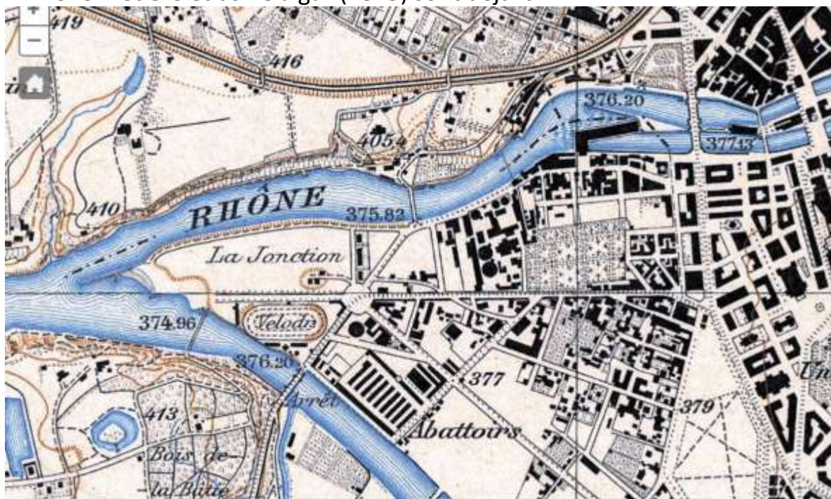
Carte Siegfried 1899

On y voit le prolongement de l'île (où se trouvaient les abattoirs) avec ses 4 passerelles dont une seule subsiste (le pont de la Coulou). A la place du Pont Sous-Terre (une passerelle construite en 1891, le pont date de 1969), on voit un projet de viaduc ferroviaire à la place du pont Sous-Terre. L'emplacement des abattoirs est déjà fixé et la rue des Abattoirs (av St-Clothilde) fini par un pont (en rouge) sur l'Arve. Cimetière et usine à gaz (1845) sont déjà là.