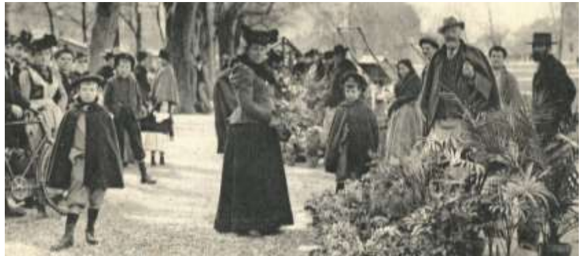
Marché aux fleurs et légumes sur la Plaine de Plainpalais

Selon l' Echo de Plainpalais , en 1896, les hommes sont plutôt adeptes de feutres et casquettes à l'américaine.